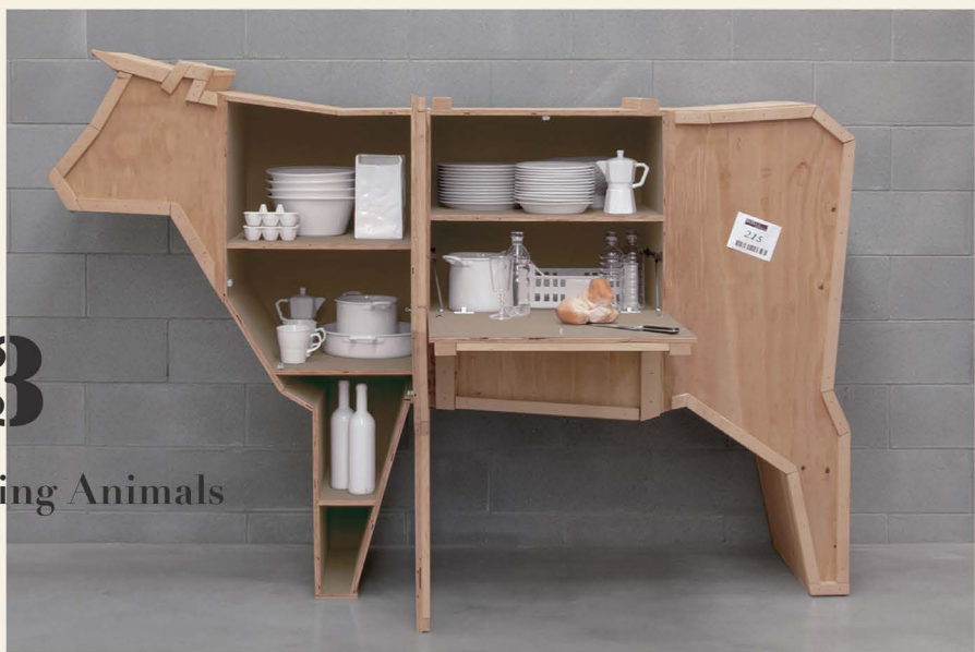
Sending Animals 收納空間形狀多遍，可以讓不同形狀大小的物品放在屬於它的格位。

設 計師 Marcantonio Raim-ondi Malerba 設計的儲物櫃，以動物的形體作為外觀，運送貨物的概念，做出 Sending Animals 系列。像是動物們遠渡重洋來到你家，木製的身體上還被標明「易碎品」「小心輕放」，彷彿不只是為了裡面的物品要留意，對動物形狀的箱子也要溫柔。不規則形狀的櫃子也提供了許多非方形的空間，讓我們可以靈活地運用這些位置，放置適合的物品，例如牛長長的四肢就很適合放酒瓶，多了許多收納的樂趣。