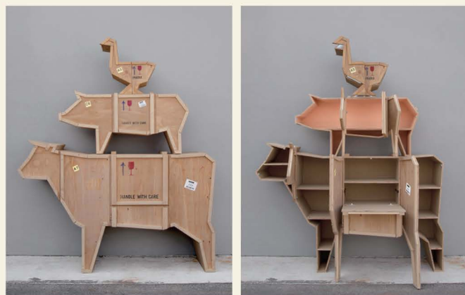
Sending Animals 牛豬鴨三種樣式