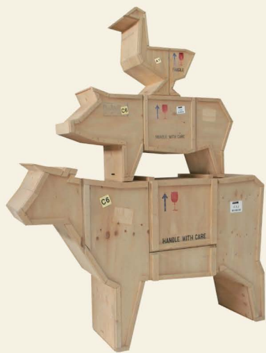
Sending Animals 外觀結合動物與貨櫃箱，還貼了「易碎品」、「小心輕放」的貼紙